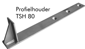
Profielhouder TSH 80

Zeer stabiel hoekprofiel gemaakt van RVS met drainagesleuven voor de afvoer van water en openingen voor bevestiging op de dakbedekking.