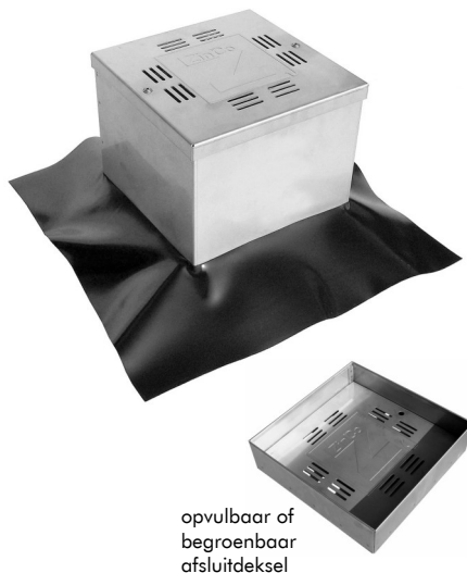
opvulbaar of begroenbaar afsluitdeksel

Controleschacht voor bescherming en inspectie van hemelwaterafvoeren op intensieve groendaken.